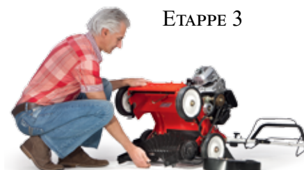
Fenêtre d'outil de retirer

La meilleure méthode pour une belle pelouse verte. Chaque printemps en automne requièrent une attention particulière. En plus de tondre la pelouse, il est également important de déchaumer régulièrement. Un scarificateur Tielbürger est l'outil idéal. Particuliers et professionnels apprécieront la performance excellente de nos gammes.